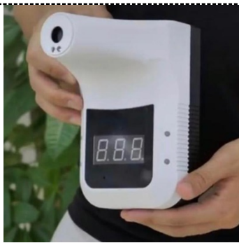
Бесконтактный термометр в базовой комплектации, может быть заменен по желанию Заказчика.