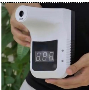
Бесконтактный термометр в базовой комплектации, может быть заменен по желанию Заказчика.