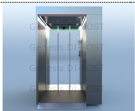
DP-03 Вид сзади

*Кабина изготовлена из специальных алюминиевых профилей с обшивкой стен окрашенным алюминиевым композитом, возможно изготовление в любых цветовых решениях или в цветах Вашего брэнда, включая нанесение логотипов.