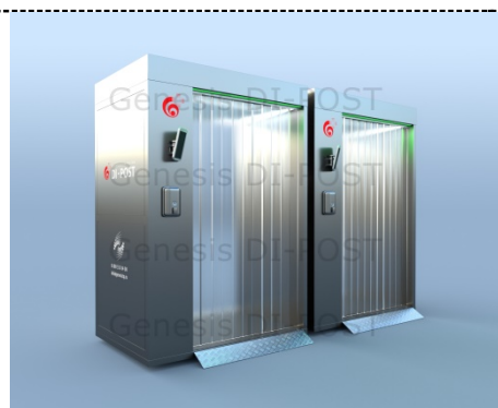
Пример компоновки DP-02

*Кабина изготовлена из специальных алюминиевых профилей с обшивкой стен окрашенным алюминиевым композитом, возможно изготовление в любых цветовых решениях или в цветах Вашего бренда, включая нанесение логотипов.