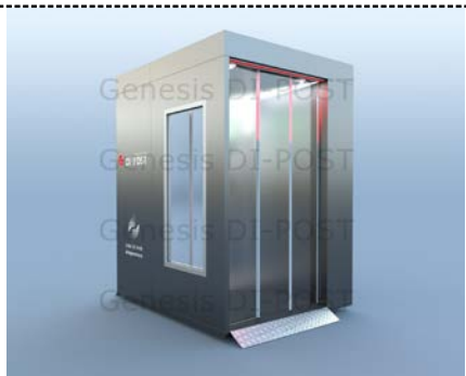
DP-04 Вид сзади

*Кабина изготовлена из специальных алюминиевых профилей с обшивкой стен окрашенным алюминиевым композитом, возможно изготовление в любых цветовых решениях или в цветах Вашего бренда, включая нанесение логотипов.